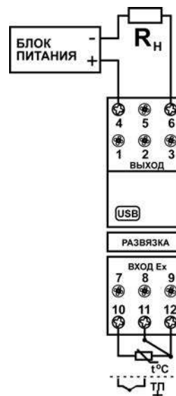
Рисунок 3.1 – Схема подключения преобразователя